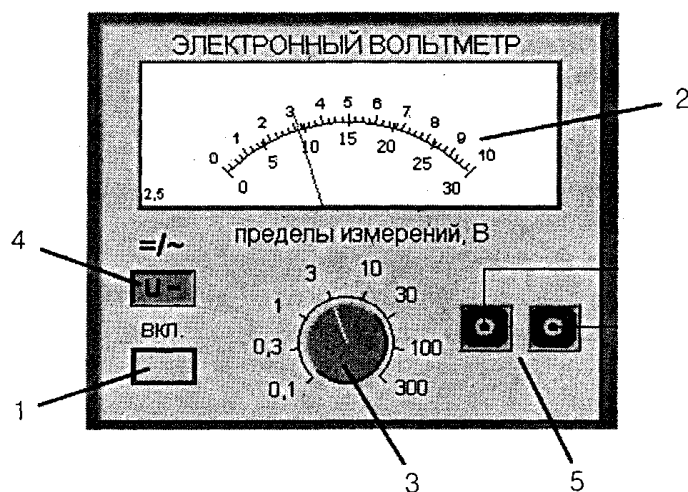
Рис П.1.9. Внешний вид модели электронного аналогового вольтметра