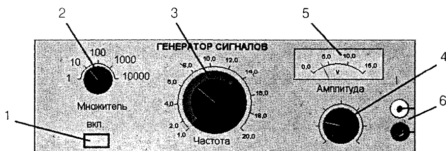
Рис П 1 16. Внешний вид модели генератора сигналов синусоидальной формы